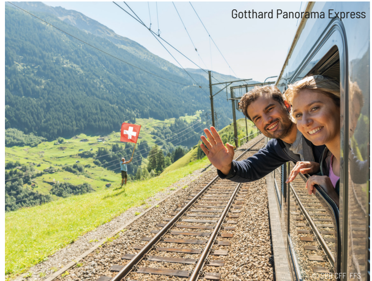
Gotthard Panorama Express