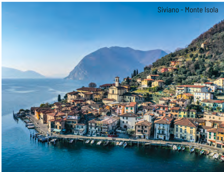
Siviano - Monte Isola