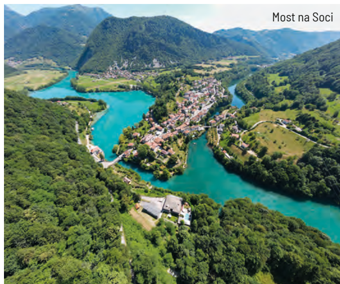
Most na Soci