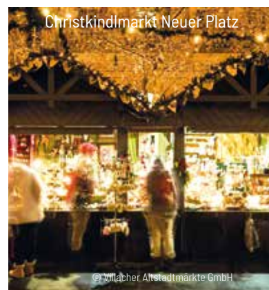
Christkindmarkt Neuer Platz