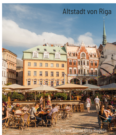
Altstadt von Riga