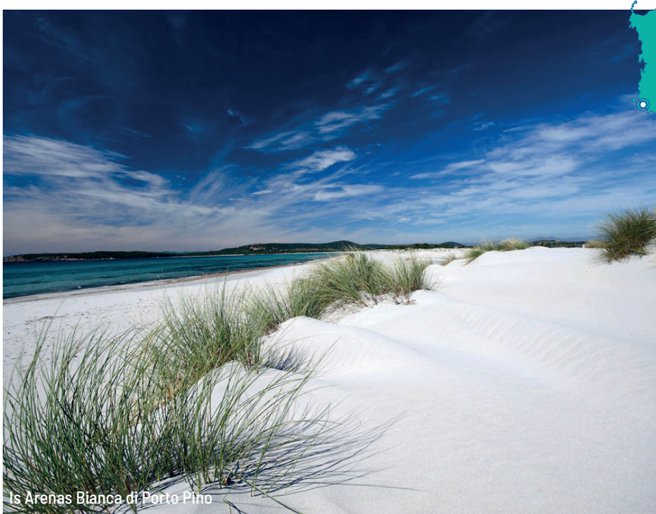
Is Arenas Bianca di Porto Pino