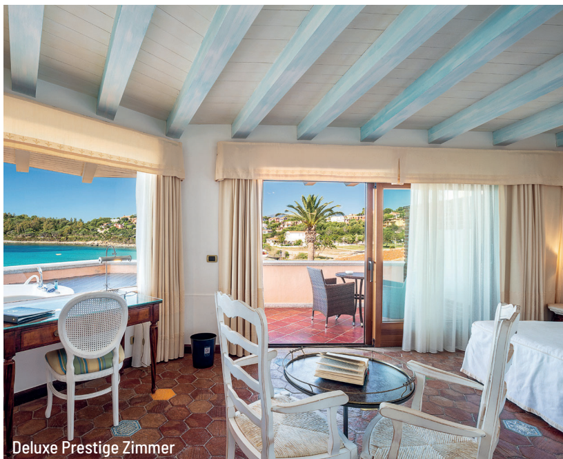
Deluxe Prestige Zimmer