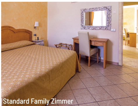
Standard Family Zimmer

Preise und Saisonszeiten: Preisteil S. 14 EDV-Code: STARPER - Flughafen Cagliari/CAG