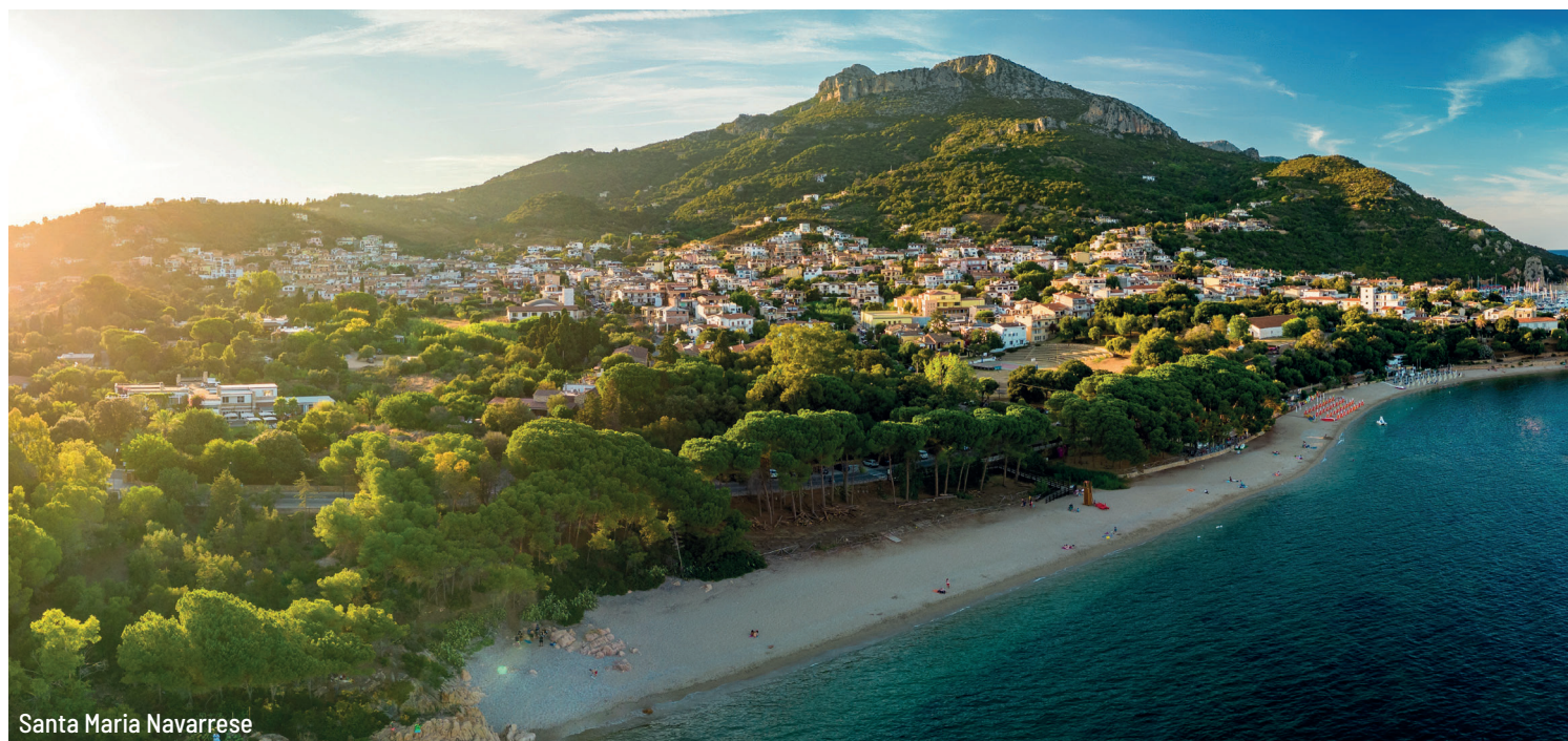
Santa Maria Navarrese