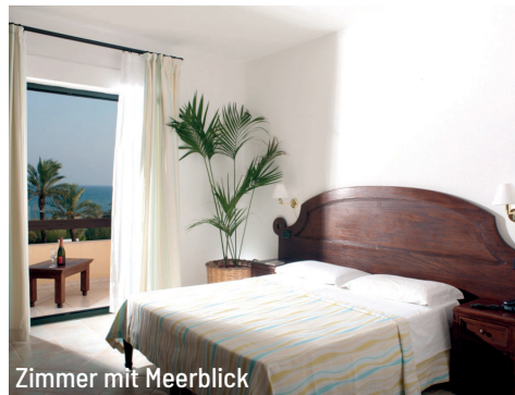
Zimmer mit Meerblick